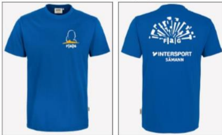
Laufshirtvorlage (nur weißer Druck, nicht gelb)

Hinweis: Ein Schullaufshirt kann, wie auch alle anderen Kleidungsstücke der FAG-Kollektion, beim Kaufhaus Sämann in der Intersport-Abteilung in einer passenden Größe in diesem blau bestellt werden. (Kindergrößen: 15,25 €, Erwachsenengrößen: 16,45 €)